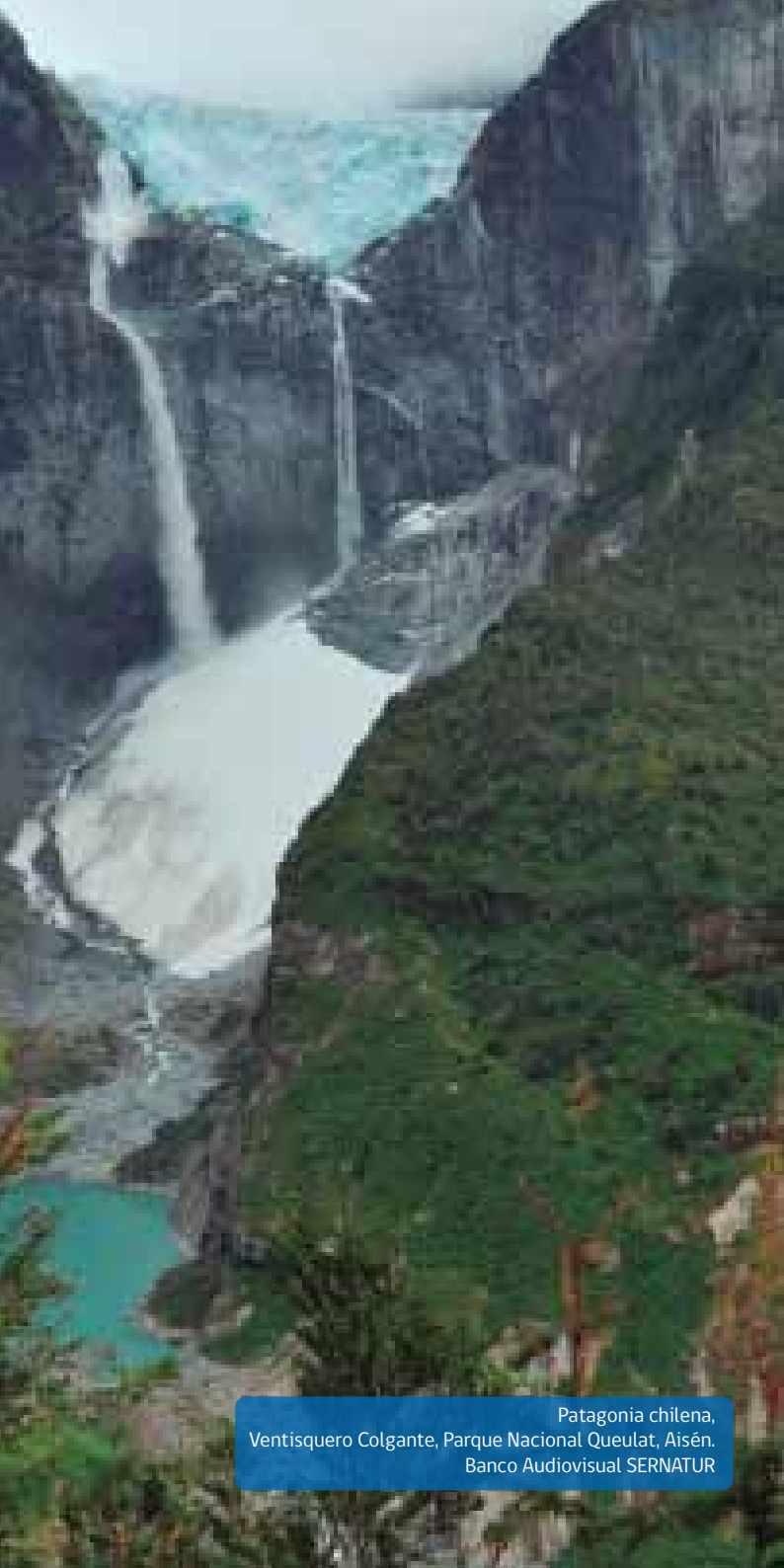
Patagonia chilena, Ventisquero Colgante, Parque Nacional Queulat, Aisén.